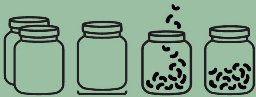
1. MITBRINGEN 2. ABWIEGEN 3. ABFÜLLEN 4. BEZAHLEN

Entdecken Sie unser breites Sortiment an regionalen, unverpackten Bio-Produkten. Kommen Sie mit Ihren eigenen Behältern vorbei und füllen Sie sich individuelle Mengen an unseren Produkten ab. So können Sie genau so viel einkaufen wie Sie benötigen und tragen aktiv zur Reduzierung von Verpackungsmüll bei. Dabei bieten wir Ihnen ein einzigartiges Einkaufserlebnis und beraten Sie jederzeit gerne.